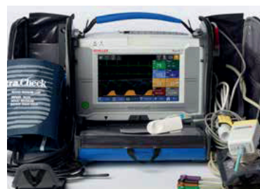
PHYSIOGARD TOUCH 7 MONITOR